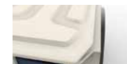
T veida rievots augšējais vāks