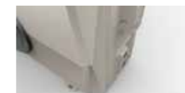
Šķelta dimanta dizains