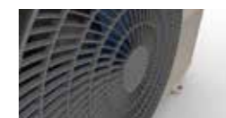
Gaisa izplūdes forma, kā Arhimēda skrūve