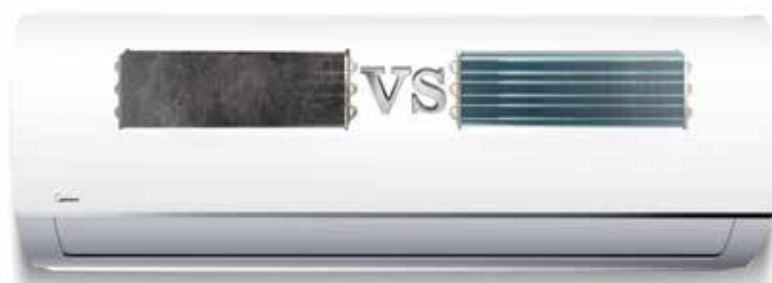
Iztvaikotāja virsma bez pašattīrīšanās

Lai nodrošinātu, ka elpojat ar svaigu gaisu visu laiku, un arī pagarinātu kondicioniera kalpošanas laiku, dzesēšanas virsma tiek notīrīta un nožāvēta automātiski.